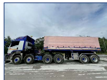
9. การปิดคลุมผ้าใบรถบรรทุก

5. ข้อมูลด้านการอนุรักษ์สิ่งแวดล้อมบริเวณใกล้เคียงชุมชน โครงการให้ความสำคัญกับพื้นที่ป่าไม้จึงให้ความรู้ ความเข้าใจ เพื่อให้คนงานตระหนักถึงความสำคัญของป่าไม้และกำหนดมาตรการห้ามพนักงานหรือคนงานเหมือง ลักลอบตัดไม้และล่าสัตว์ป่า รวมทั้งไข่และตัวอ่อนของสัตว์ป่าบริเวณโครงการและพื้นที่ป่าไม้บริเวณใกล้เคียงอย่างเด็ดขาด และจะต้องมีบทลงโทษที่จะต้องนำมาปฏิบัติอย่างเคร่งครัด