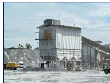
3. ดูแลโรงโม่หินของโครงการให้เป็นไปตามประกาศกรมอุตสาหกรรมพื้นฐานและการเหมืองแร่