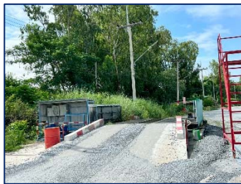
2. จุดล้างล้อก่อนออกพื้นที่โครงการ