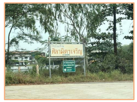
ป้ายสำนักงานโครงการ