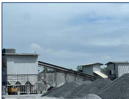
โรงโม่หินของโครงการ