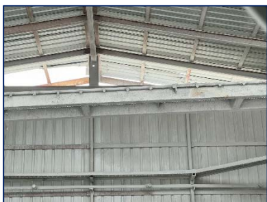
4. จุดสเปรย์น้ำบริเวณปากโม่หิน