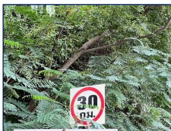
8. จำกัดความเร็วของรถบรรทุกให้ไม่เกิน 30 กม./ชม.