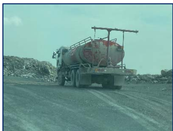
1. ฉีดพรมน้ำบริเวณที่ก่อให้เกิดฝุ่นละออง