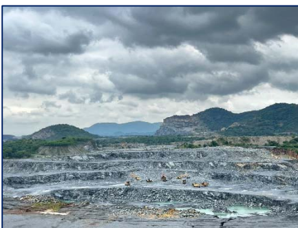
บริเวณพื้นที่ทำเหมืองปัจจุบัน