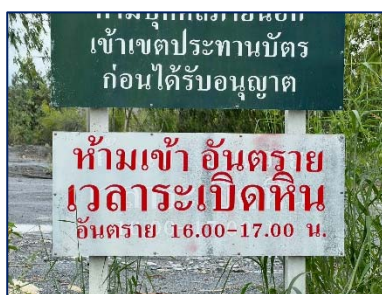
5. กำหนดระยะเวลาการระบดเปิดไม่เกินวันละ 1 ครั้ง ในช่วงเวลา 16.00-17.00 น.