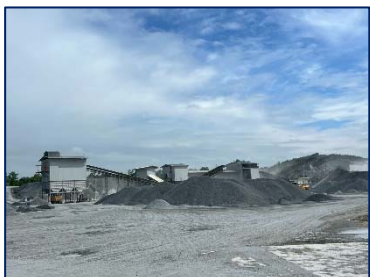
7. พื้นที่กองแร่